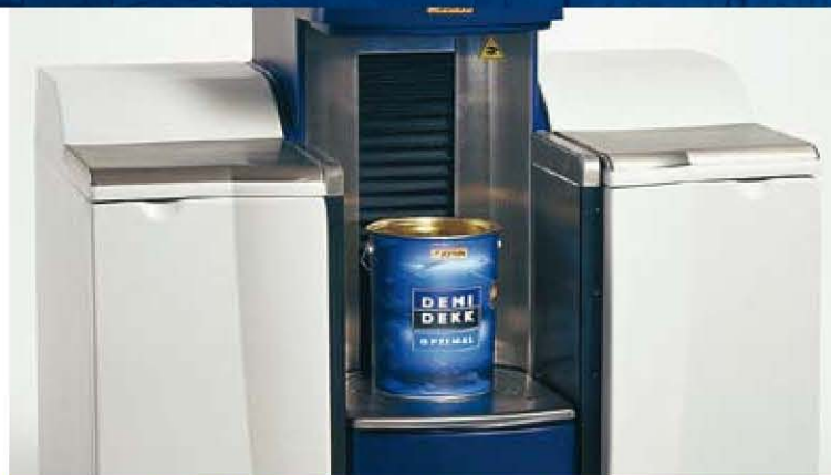
Für DEMIDEKK stehen eine Vielzahl von Farbtönen zur Auswahl

Mit DEMIDEKK Optimal Fenster- und Türenqualität steht Ihnen ein Produkt zur Verfügung, das dem neuesten Stand der Technik mit jahrzehntelanger Erfahrung vereint. So wurde die bewährte AMA-Technologie (Alkydharzmodifiziertes Acrylat) erstmals auf ein Produkt für Fenster und Türen angewendet. Die bekannten Vorteile, wie gute Penetration, hohe Glanz- und Farbtonstabilität sowie optimaler UV- und Wetterschutz, konnten so vereint werden ohne dabei wichtige Faktoren, wie hohe Blockfestigkeit, guter Verlauf und kurze Trockenzeiten außer Acht zu lassen. Kurz: Mit DEMIDEKK Optimal Fenster- und Türenqualität halten Sie ein absolutes Spitzenprodukt für den langfristigen Schutz Ihrer Fenster und Türen in den Händen.